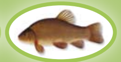
Schleie - 25 cm