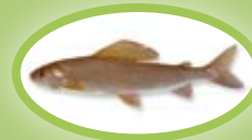
Äsche - 35 cm