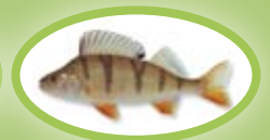
Barsch - 22 cm