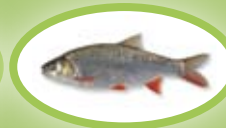
Aland - 30 cm