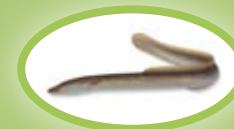
Aal - 28 cm